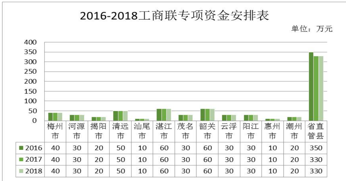
图 1-1 工商联专项资金安排图