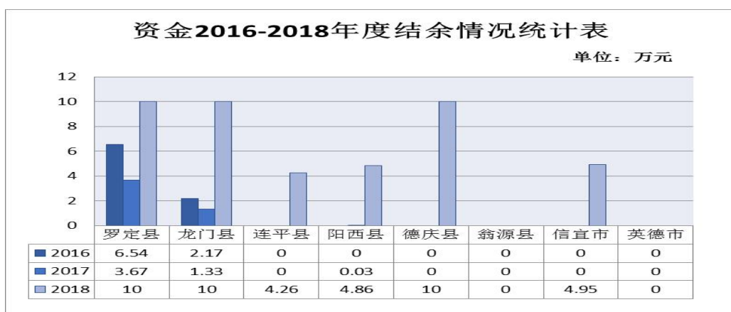
图 1-34 资金 2016-2018 年度结余情况统计 表图

部分地区存在资金支付率过低的情况，一定程度上影响了工商联的自身发展。经抽查 8 个地区的县级工商联，发现罗定市、2016、2017 年资金平均支付率为 48.95%。支付率较低，通过跟罗定市工商联领导小组成员了解，是因为对资金的使用范围不理解而未能充分将资金使用到位。