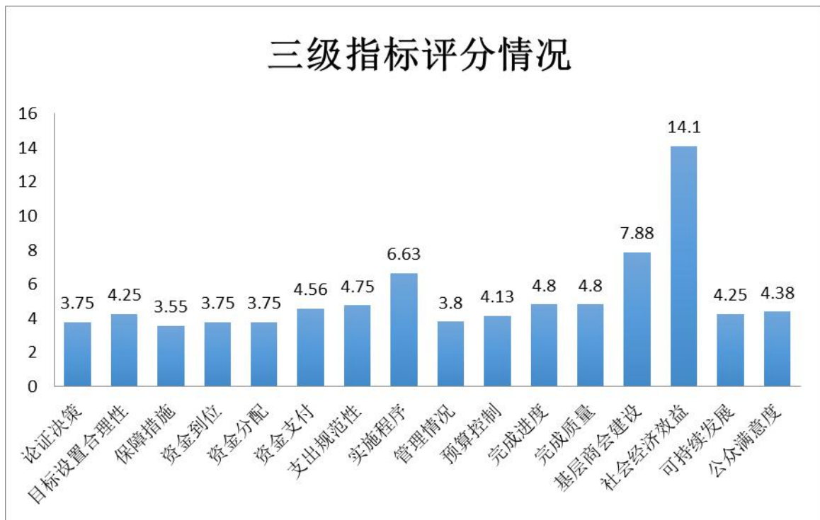
表图 1-2 三级指标评分情况图