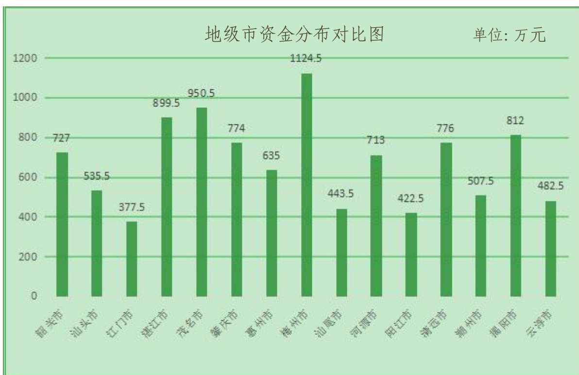
图 1-2 指标对比图